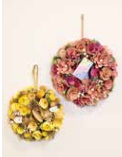
フラワーリース (Mサイズ)3,630円 (Sサイズ)2,750円