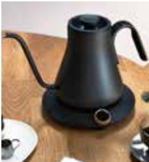
「EPEIOS」 『Fine&Flow』 ドリップケトル 13,200円