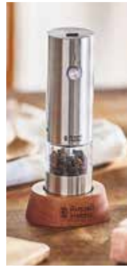
「ラッセルホブズ」 充電式ミル ソルト&ペッパー ミニ 4,400円