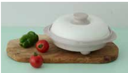
「レンジメート」レンジメート プロ 9,900円

今話題の電子レンジ専用調理器具。 電子レンジ調理でありながら、直火で焼いたような 『焼き目』がついた仕上がりに。