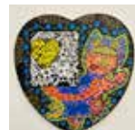
たいぞう 「心から楽しむ」