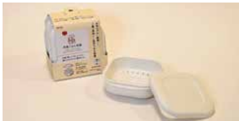
極 冷凍ごはん容器2個入り ホワイト 1,281円