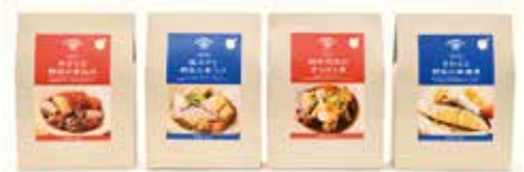
アコメヤのミールキット各種 各1,080円