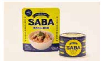
オリジナルさば缶deご飯焼きさばご飯の素 194円