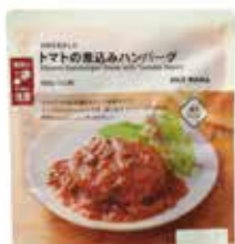
素材を生かしたトマトの煮込みハンバーグ 350円

レンジでそのまま温めるだけのお惣菜です。 ふっくらとしたハンバーグを、揚げ茄子やオリーブを 加えた濃厚なトマトソースで煮込みました。