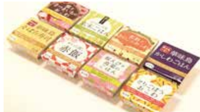
おこわ各種(冷凍)(とりごぼうおこわ、紅鮭ときのこのおこわ、 ちりめん高菜玄米ごはんなど) 各324~486円

食べたいときにレンジで簡単調理。 こだわり食材とふっくらおいしいお米の一膳ごはんです。