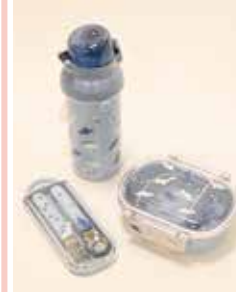
<はじめてのお弁当シリーズ> 抗菌はじめての弁当箱 (360ml)