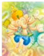
あおきよしえ 「おどる ガネーシャ 読書大好き」