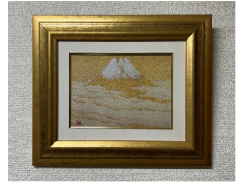
西陣織アート「西進」