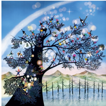
「こびとたちの大きな祈り」