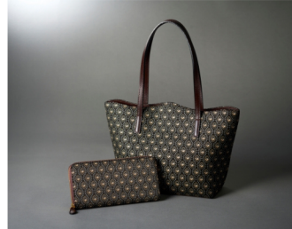
甲州印傳「印傳屋上原勇七」

職人の手仕事による暮らしの道具やアイテムを 日々の暮らしに取り入れてみませんか。