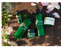
「オーガニック・ボタニクス」