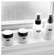
「キャロルブリスト」