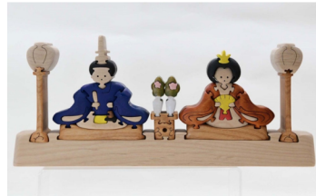
木製品・立体バスル「CRAFT BIRD WOOD」