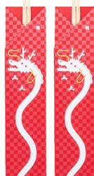
◇「京都烏丸六七堂」 敷き紙、祝い箸