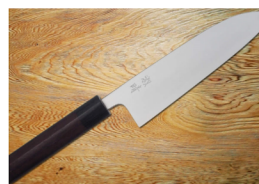
「迫田刃物」 土佐打刃物 ※包丁研ぎも承ります