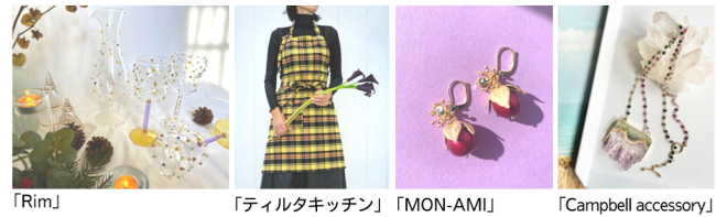
「Rim」 「ティルダキッチン」 「MON-AMI」 「Campbell accessory」

「クリスマスギフトマルシェ」 センス溢れるキッチン雑貨やアクセサリなど、クリスマスギフトにおすすめのアイテムをご紹介します。 ◎12月6日(水)～12日(火) ※最終日は午後6時終了。