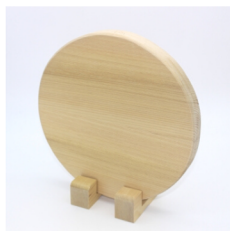
「工房なるみ」 ひば細工