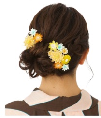
◇「ミキクリエート」 つまみ細工の和装髪飾り 成人式にも

食料品売場の週替わりイベントや、各階のおすすめ情報は 【千里阪急のホームページ】 【千里阪急公式LINE】 をチェック！