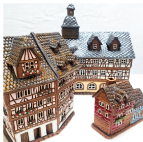
「リガコレクション」 陶器のキャンドルハウス

「北欧ウィーク」で扱う商品は、一部北欧以外の国(地域)で生産または原材料を使用した商品もございます。