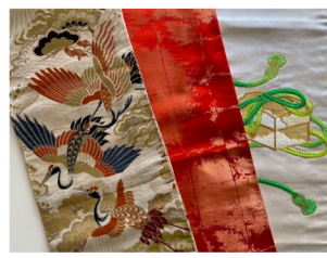
◇「アンブリュストロフ」 ハンドメイドのエプロンなど。 迎春テーブルランナー