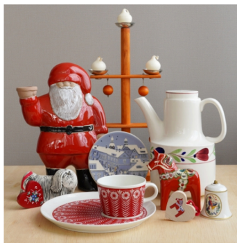
「EN HALV」(エン ハルヴ) 北欧雑貨