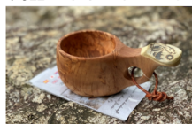
「THE DAY JAPAN」 クササ(木製マグカップ)