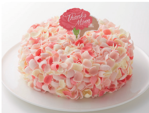
「モロゾフ」マザーズデー グルノーブル (直径15cm) 1,944円 ◎洋菓子売場 ※10日(金)~12日(日)の販売