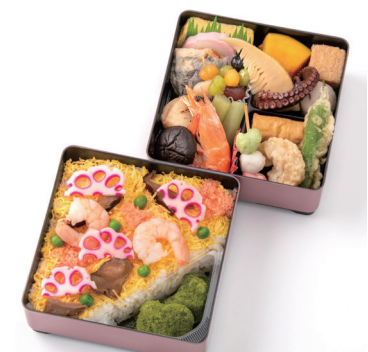
「淡路屋」 母の日二段重 (1人前) 2,160円 ◎惣菜売場 ※10日(金)~12日(日)の販売