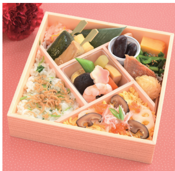
「梅の花」 母の日弁当 (1人前) 1,620円 ◎惣菜売場 ※11日(土)・12日(日)の販売