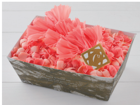
「シーキューブ」ディアマザー (長さ15.5cm) 1,944円 ◎洋菓子売場 ※10日(金)~12日(日)の販売