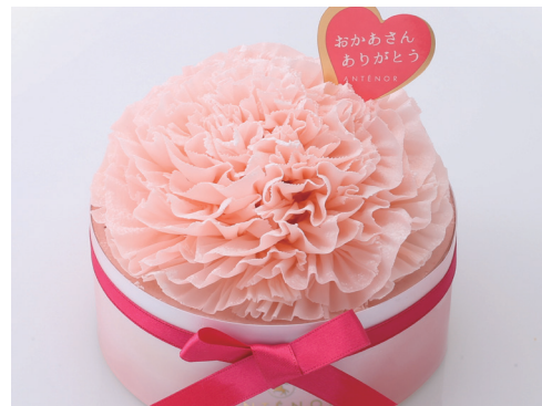
「アンテノール」カーネーション (直径12cm) 3,240円 ◎洋菓子売場 ※10日(金)~12日(日)の販売