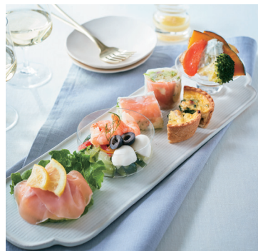
「RF1」 ワインと愉しむアンティパスト セット(1パック) 1,290円 ◎惣菜売場