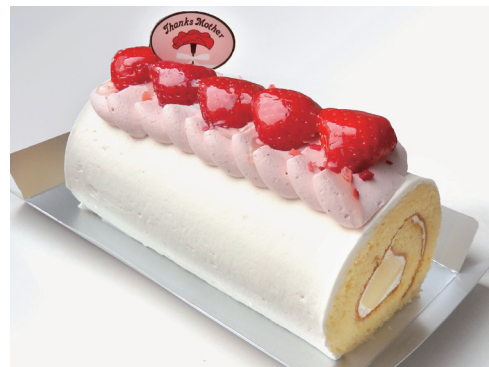
「ユーハイム」母の日ロール (長さ15cm) 2,160円 ◎洋菓子売場 ※11日(土)・12日(日)の販売