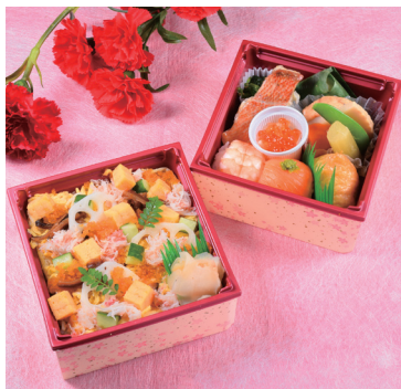
「古市庵」 母の日二段重 (1人前) 1,599円 ◎惣菜売場 ※12日(日)のみの販売