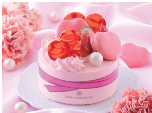
「アンリ・シャルパンティエ」 メルシー・ママン(直径12cm) 3,024円 ◎洋菓子売場 ※10日(金)~12日(日)の販売