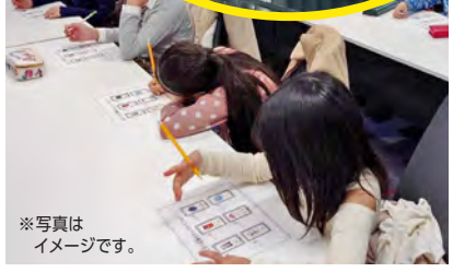
※写真はイメージです。