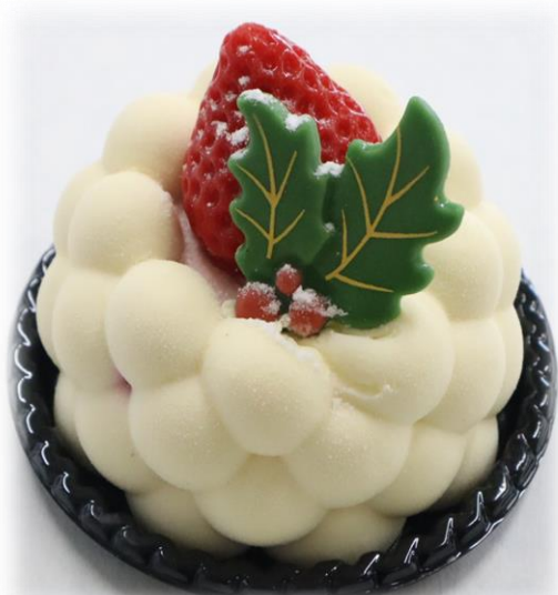
エミリエ 864円(税込) ホワイトチョコと フランボワーズ の組み合わせ