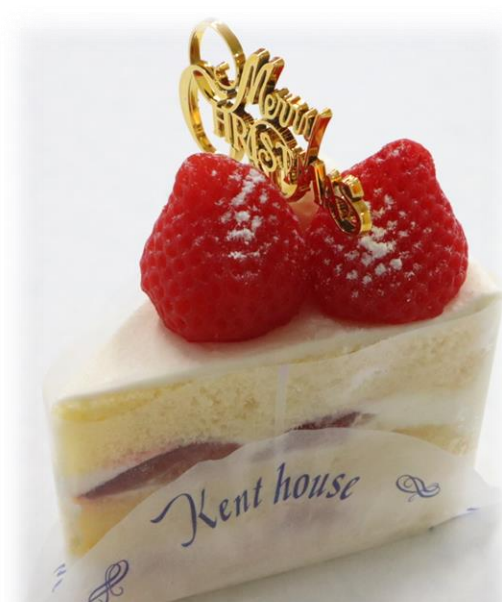
苺のショートケーキ 810円(税込) 人気NO.1の ショートケーキ