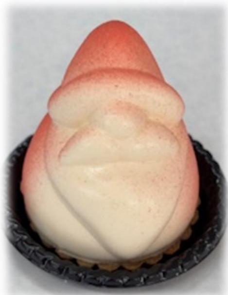
サンタ 918円(税込) チーズクリームと 苺の組み合わせ