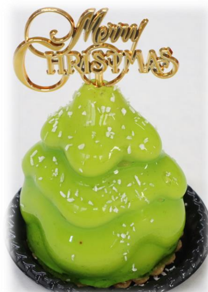
クリスマスツリー 918円(税込) ピスタチオムースと苺 の組み合わせ