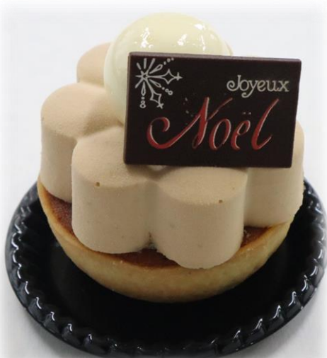
アールグレイ 810円(税込) アールグレイが主役の 香り高いケーキ