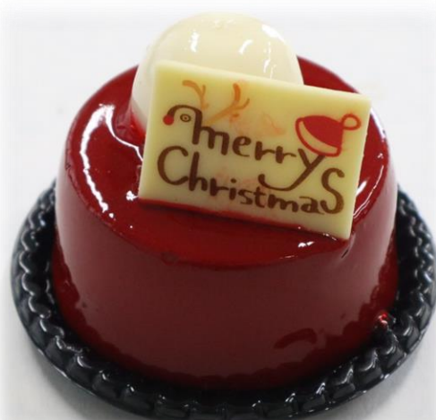
ショコラフランボワーズ 810円(税込) ラズベリーとショコラの 組み合わせ