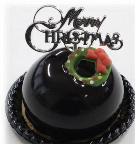
トロアショコラ 810円(税込) 3種のチョコレートを 使用したケーキ