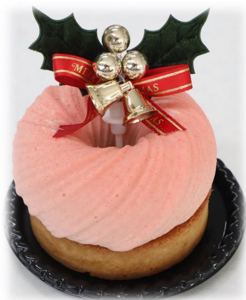
クリスマスリース 918円(税込) 苺ムースとマスカル ポーネの組み合わせ