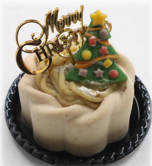
マロンショコラ 864円(税込) マロンクリームと ショコラの組み合わせ