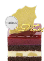
ひいらぎのは 柊の葉 ーカシス・ポワールー