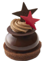
ほしのまたたき 星の瞬き ーチェリー・ショコラー