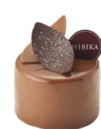
ふゆのかぜ 冬の風 ーショコラとクルミヌガーー