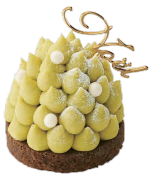
もみのゆき もみの雪 ーピスタチオ・ベリーー