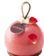
せいやのきらめき 聖夜のきらめき ーベリー・ヴァンルーージュー