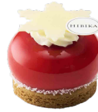
せいやのけっしょう 聖夜の結晶 ーショコラブラン・フランボワーズー