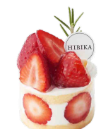
ふゆいちご 冬苺 ーいちごのショートケーキー