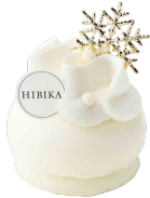
ゆきふるよる 雪降る夜 ーフロマージュ・フレーズー