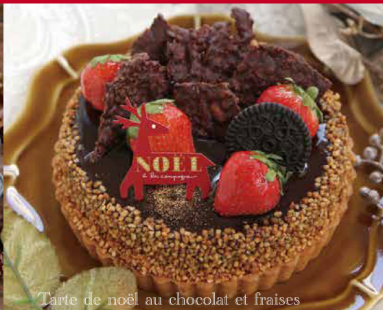
Tarte de Noël au chocolat et fraises