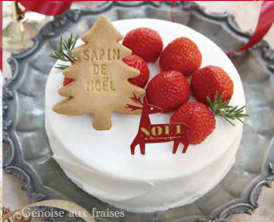
Génoise aux fraises