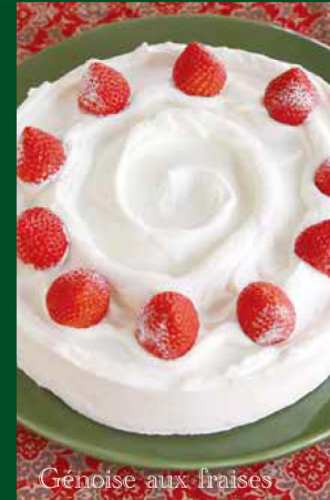
Génoise aux fraises