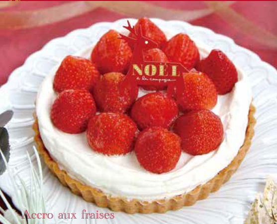
Accro aux fraises