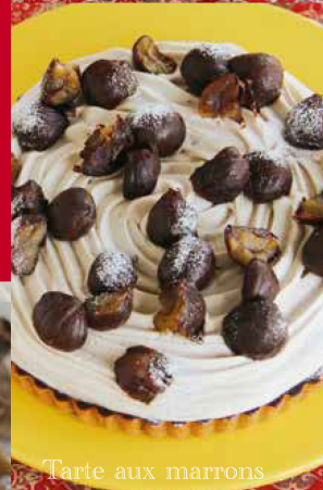
Tarte aux marrons