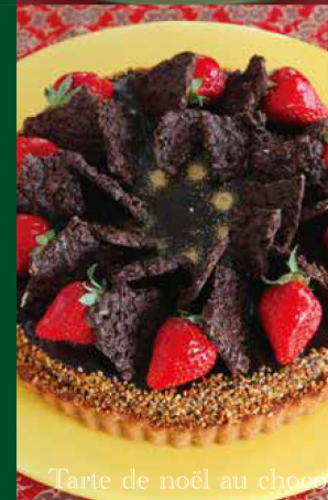
Tarte de Noël au chocolat et fraise