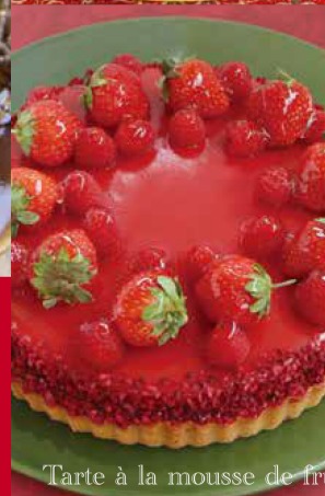
Tarte à la mousse de fruits rouges