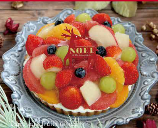
Tarte aux fruits divers