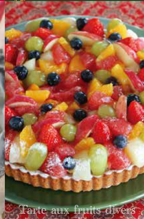
Tarte aux fruits divers