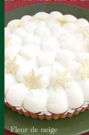
Fleur de neige