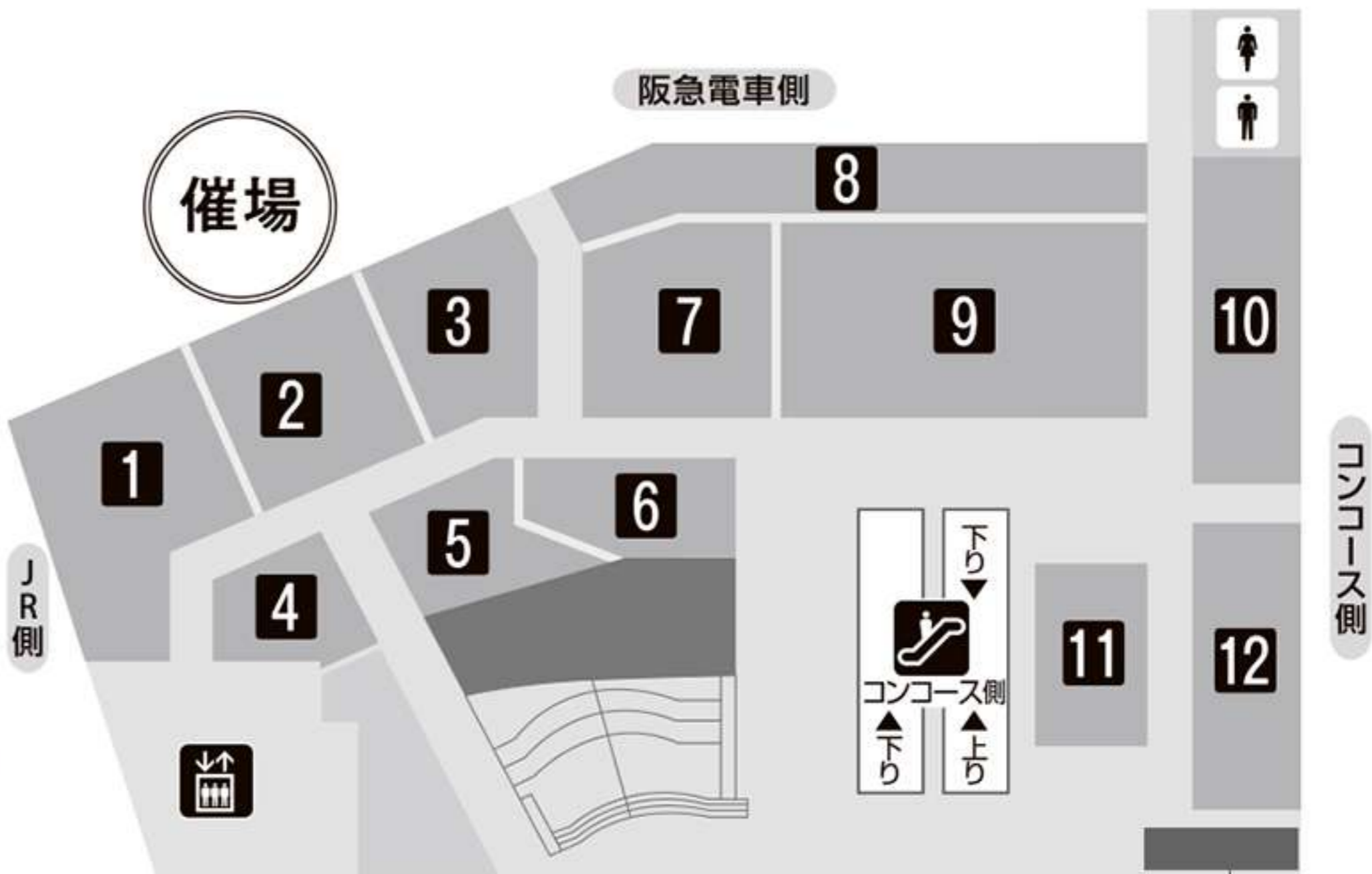
[@hankyuworldfairインスタグラムプレゼントキャンペーン]お渡しカウンター

連日 午前10時→午後8時(阪急メンズ大阪、レストランなど一部売場を除く) ※営業時間に変更になる場合がございます。